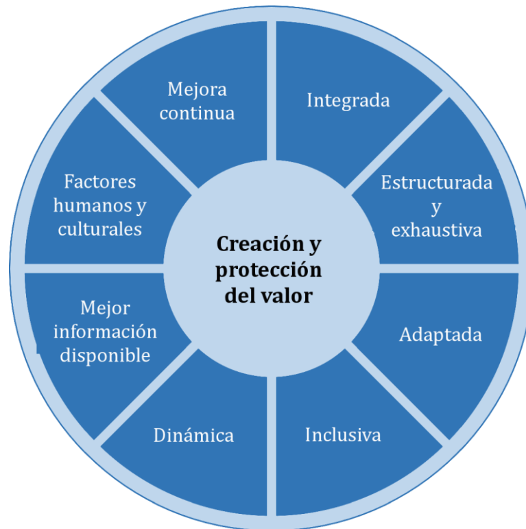
Figura 2 — Principios

Los principios descritos en la Figura 2 proporcionan orientación sobre las características de una gestión del riesgo eficaz y eficiente, comunicando su valor y explicando su intención y propósito. Los principios son el fundamento de la gestión del riesgo y se deberían considerar cuando se establece el marco de referencia y los procesos de la gestión del riesgo de la organización. Estos principios deberían habilitar a la organización para gestionar los efectos de la incertidumbre sobre sus objetivos.